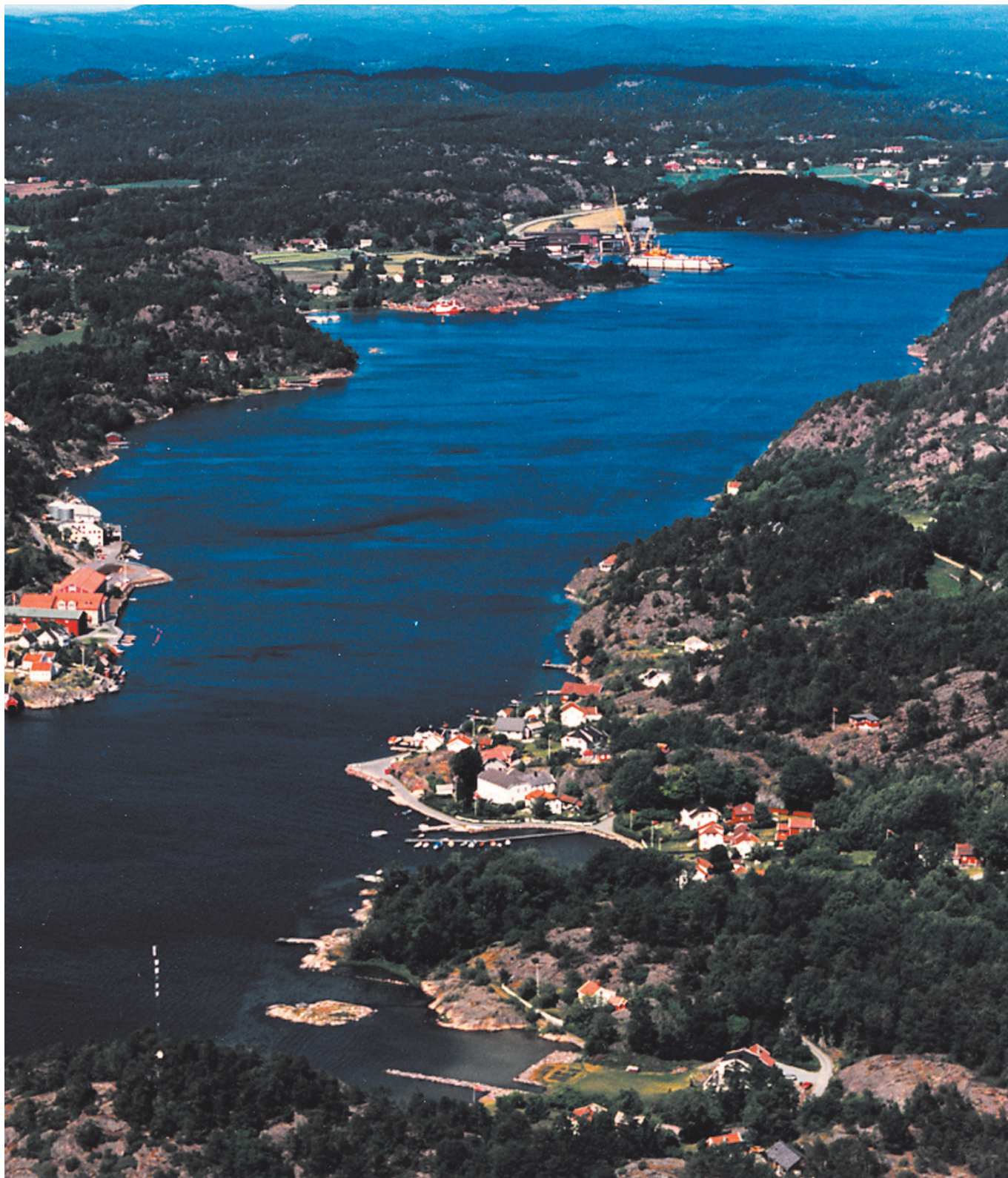
Vikkilen, Grimstad. J.J. Ugland selskapenes hovedkvarter med Nymo og Uglands administrasjonskontor innerst i bukten til venstre. / Vikkilen, Grimstad, Norway. The J.J. Ugland Companies' headquarters with the Nymo yard and Ugland's administration office situated innermost in the bay to the left.