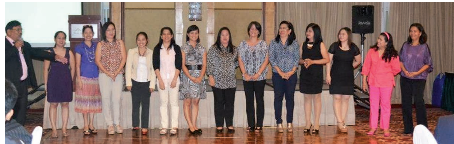
Center top: All conference participants.