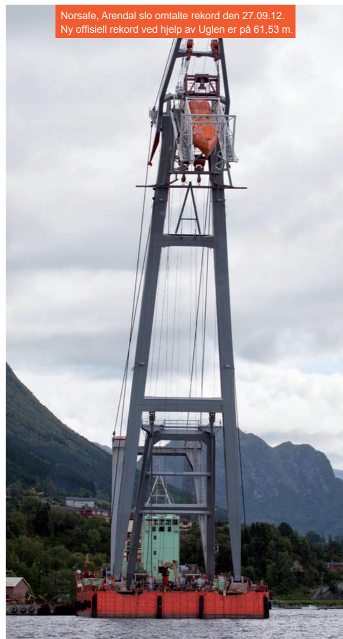
Norsafe, Arendal slo omtalte rekord den 27.09.12. Ny offisiell rekord ved hjelp av Uglen er på 61,53 m.

Uglen har ved flere anledninger vært med på stuplivbåt-tester både for Umoe Schat-Harding Equipment AS og Norsafe. De første fritt fall-testene av livbåt er fra tidlig på 1980-tallet hvor man istedenfor sandsekker testet med frivillige om bord fra lavere høyde. Etter sigende skal kokken på Uglen ha vært en av de frivillige.